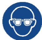
Tesno prilegajoča se zaščitna očala